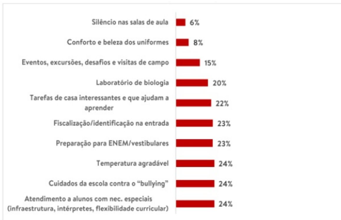
Imagem 3: Atributos com piores avaliações na EE Coronel Adelino Castelo Branco

Base: 195 alunos da Escola Estadual Coronel Adelino Castelo Branco